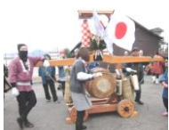
↑ 鳥追い太鼓の様子 (27. 1.14)