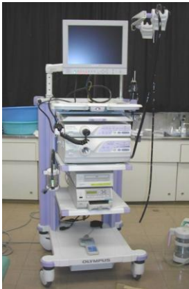
電子内視鏡 (胃カメラ)