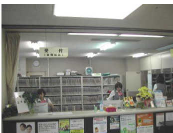
※7名のスタッフで業務の分担を行っております