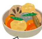
副菜1 野菜・きのこ・海藻など