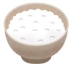
主食 ご飯・パンなど