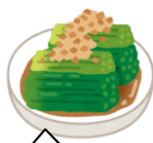
副菜2 野菜・きのこ・海藻など