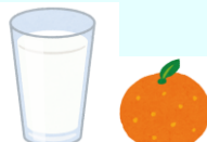
乳製品や果物は食後や間食に取り入れてカルシウムやビタミンを補給しましょう。