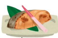
主菜 肉・魚介・豆製品・卵など