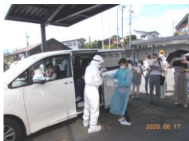
↑さまざまな医療チームの例

地元の医療機関や自治体関係者ら約60名が、患者の誘導方法や検体採取の方法などを確認しました。